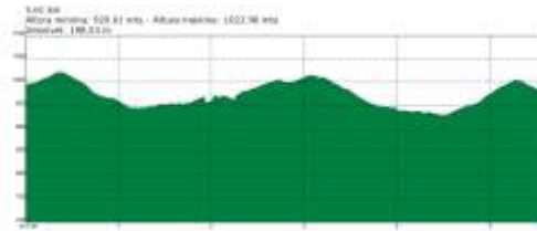
desde Villanueva de Henares

El regreso se realiza saliendo del claro del bosque hacia el noroeste, siguiendo un difuminado camino que por prados jalonados de bosquetes de roble y manchas de brezo nos conduce hacia una amplia campiña. Topamos arriba con un camino transversal que tomaremos a la izquierda. Dicho camino, sin pérdida, tras un interesante tramo atravesando un espeso robledal, llega a la portilla ganadera. De ahí, arranca el camino de vuelta a Villanueva de Henares.